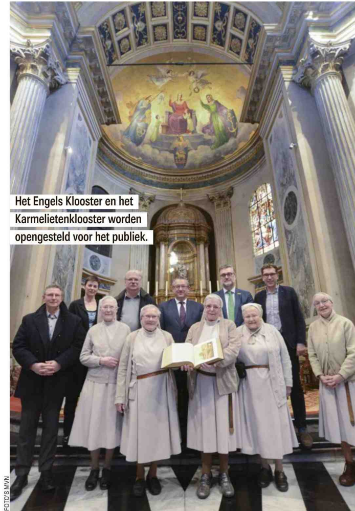
Het Engels Klooster en het Karmelietenklooster worden opengesteld voor het publiek.

In februari volgend jaar wil de organisatie van start gaan met de rondleidingen, die ongeveer een uur zullen duren. Hoeveel een bezoek