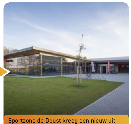
Sportzone de Deust kreeg een nieuw uitzicht. Vlaanderen kwam voor de aanleg van de omleidingsweg en rotonde tussen voor 75% van de kostprijs.