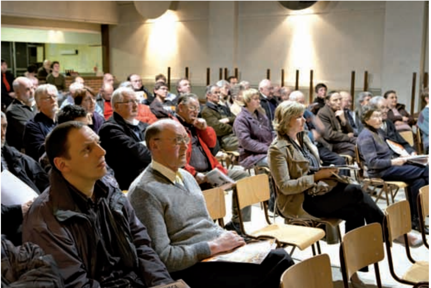
Heel wat Moerbekenaars namen deel aan de infoavond over het gemeentelijke ruimtelijk structuurplan.

Onrecht doende aan het detail, de enquête bevatte immers zowel een kwantitatief als uitgebreid kwalitatief luik, komen er een aantal lijnen naar voor. Voor wat betreft de bestemming gronden van de site suikerfabriek, zijn de keuzes verdeeld, maar is er een grote meerderheid te vinden voor een combinatie van woon-, recreatiezone en openbaar nut. Een niet te verwaarlozen minderheid kiest voor bestemming bedrijvigheid, mits bepaalde voorwaarden van milieu- of lawaaihinder worden gerespecteerd.